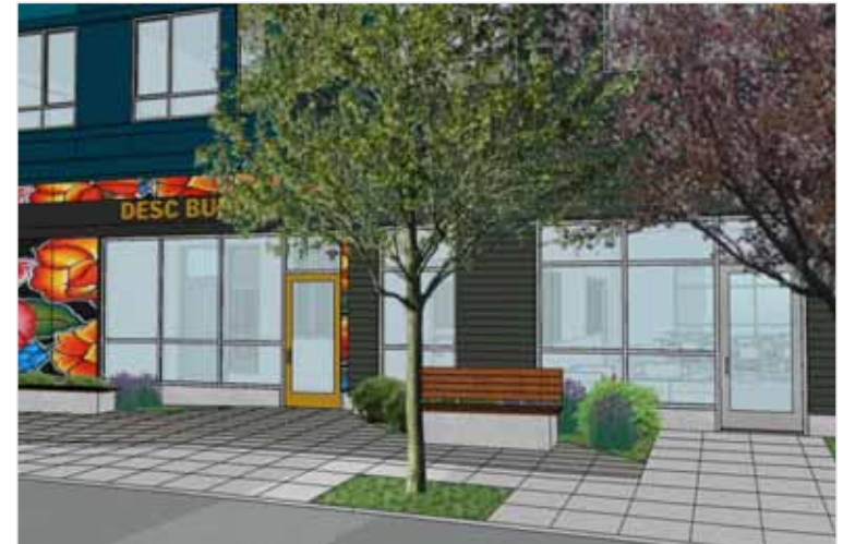
Entrada de la Sala Comunitaria por la calle 150 SW, arriba