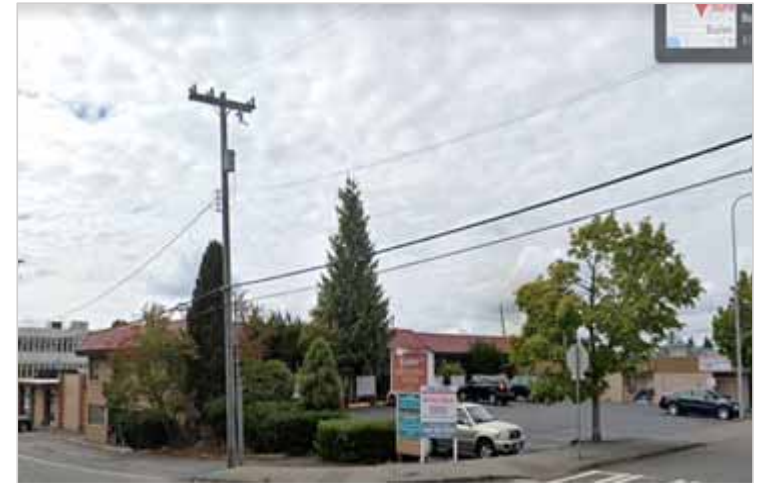
Vista de la calle actual, arriba