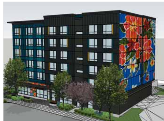
El mural floral marca el lugar para el arte local.