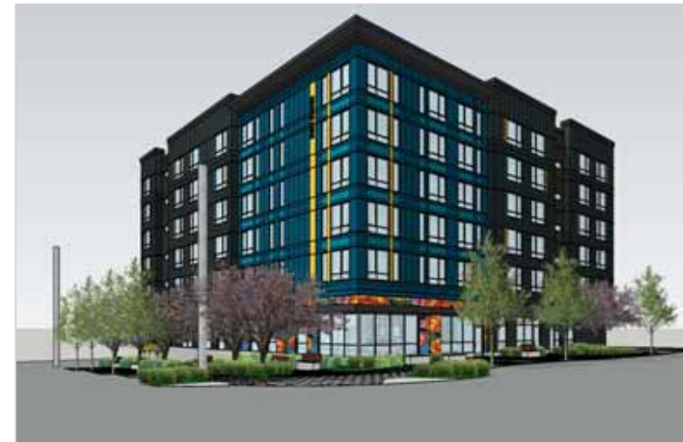
DESC Burien, abajo (SMR Architects)